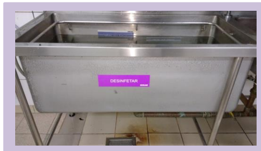
Encher a cuba até a etiqueta de nível de água