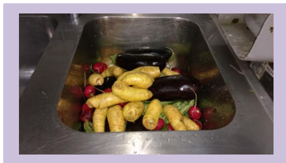
Fazer a pré lavagem dos alimentos, para retirar resíduos