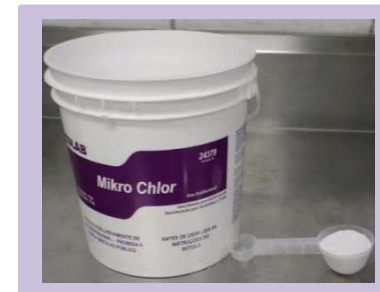
Dosar o produto manualmente na quantidade indicada, 1grama/ Litro Misture a solução dentro da cuba ate diluir todo o pó.