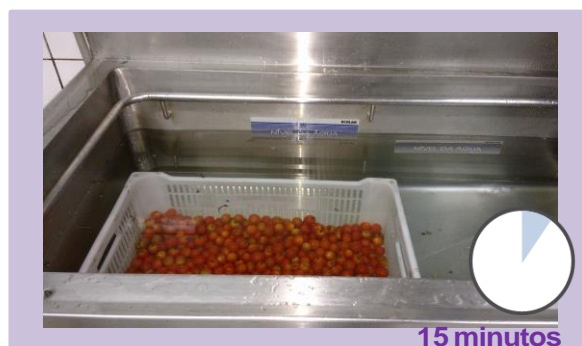
Deixar os alimentos por imersão por 15 minutos